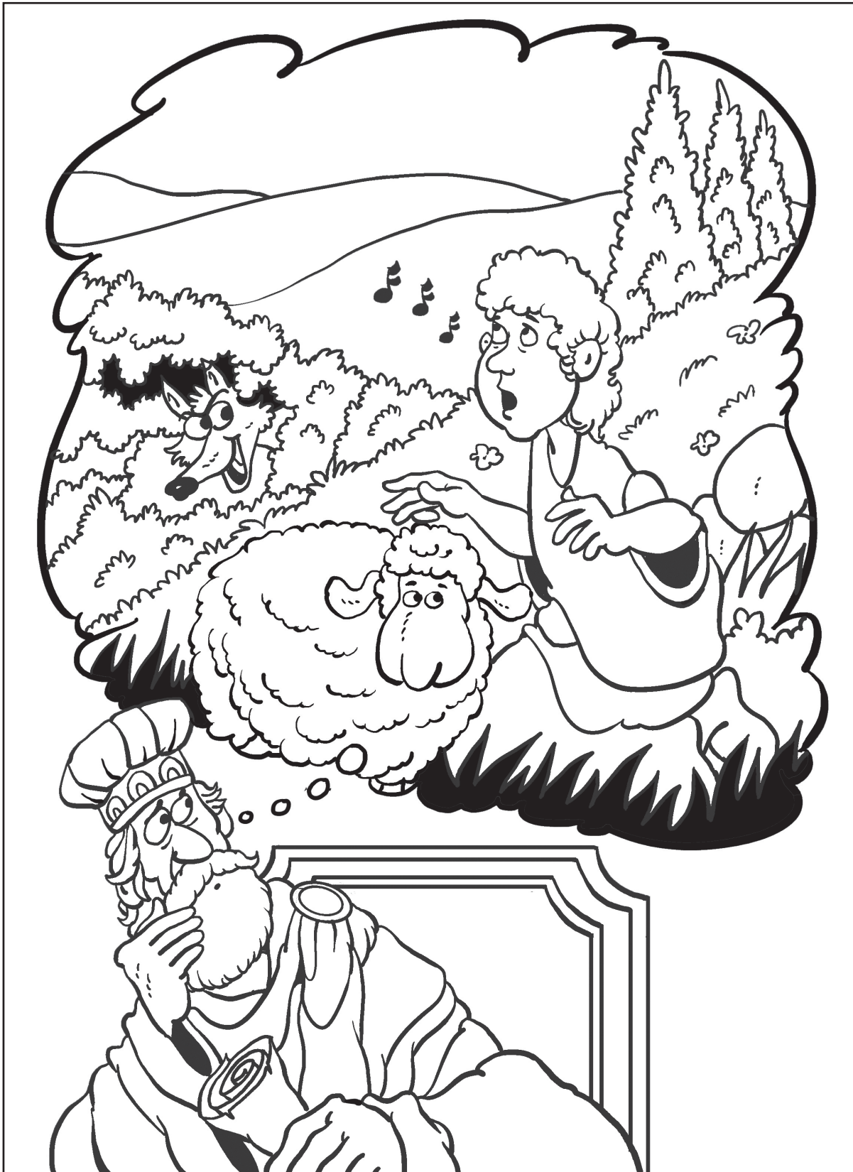
El Rey David recuerda que Dios siempre está con él.